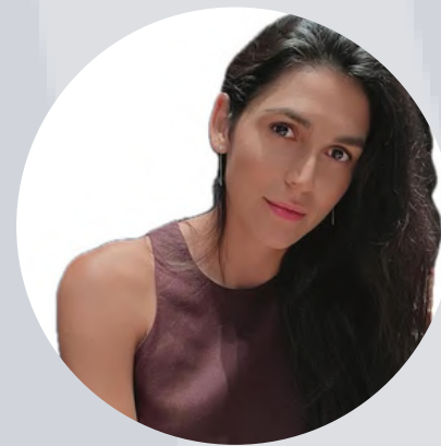
Russani Directora creativa

Cada día nuestros ilustradores crean y actualizan los catálogos de GG Real Estate Barcelona, donde recogen para los clientes la mejor selección de los proyectos inmobiliarios tanto en construcción como terminados y más interesantes para vivir e invertir.